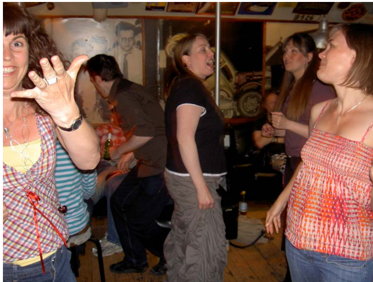
Högtryck på Klubb Sunkits dansgolv.