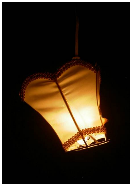
Osannolik lampa på Klubb Sunkit.

Det är trångt i den lilla källarlokalen. Ölen flödar i baren. Folk trängs kring de fåtal bord som är placerade utmed väggarna. På dansgolvet rör sig män och kvinnor i blandade åldrar till musiken som spelas. Volymen är hög, men inte för hög. Står man tillräckligt tätt är det möjligt att samtala utan att skrika. Det skulle kunna vara vilken klubb som helst om det inte vore för vissa detaljer. Inredningen är minst sagt brokig. I baren rullar en gympingvideo med Jane Fonda, barstolarna är designade som mjölkkrukor, försedda med skinnsittsar, från taket hänger uppochnedvända fönsterlampor. Ett cykelstyre är placerat vid öltapparna, somliga lysrör har försetts med flugpappersliknande hölje i grönt och orange. Men det är framför allt mu-