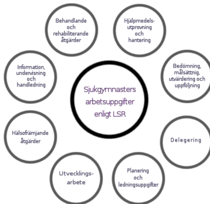
Figur 1. Arbetsområden enligt LSR:s arbetsbeskrivning (LSR 2012b), visualiserad för denna studie av Tomas Mårtensson.