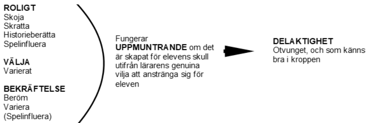
Figur 1. Aktiviteter och handlingar som fungerar uppmuntrande och därmed får eleven att vilja vara delaktig.

Figur 1 nedan sammanfattar de begrepp och aktiviteter som jag relaterat till lärares uppmuntrande strategier. Dessa är aktiviteter som elever framhållit att de uppskattar för att det får dem att känna sig glada och positiva, vilket ökar viljan till delaktighet. Är det roligt blir det medryckande och då lär man sig automatiskt, utan att man märker det. I de fall då man måste lära sig något som man tycker är mindre roligt underlättar det om man kan lockas av något (ett slags morot såsom exempelvis guldstjärnor) eller får bryta av med något roligt. Det får gärna uppfattas som en belöning för att eleven har gjort bra ifrån sig trots att innehållet inte var så roligt. Liknande medryckande effekt får också en lärare med ambitioner om att vilja skapa roliga aktiviteter för elevens skull. Lärare som vill vara snälla, vill elever i sin tur vara snälla tillbaka mot. Elever som känner av lärares genuina omtanke upplever att det är nog för att värdera läraren, oavsett utfall.